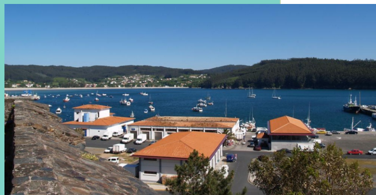
Porto de Cedeira