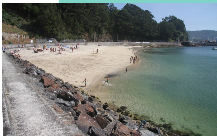
Praia de Arealonga