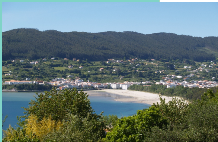
Praia da Madalena