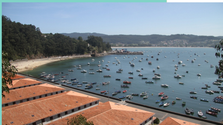
Praia de Arealonga e porto de Cedeira