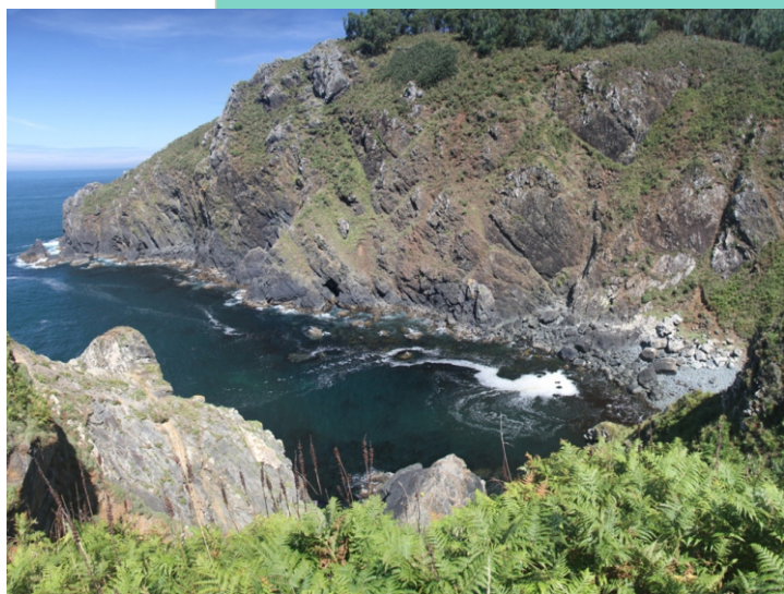
Punta Falcoeira desde a Punta Sarridal