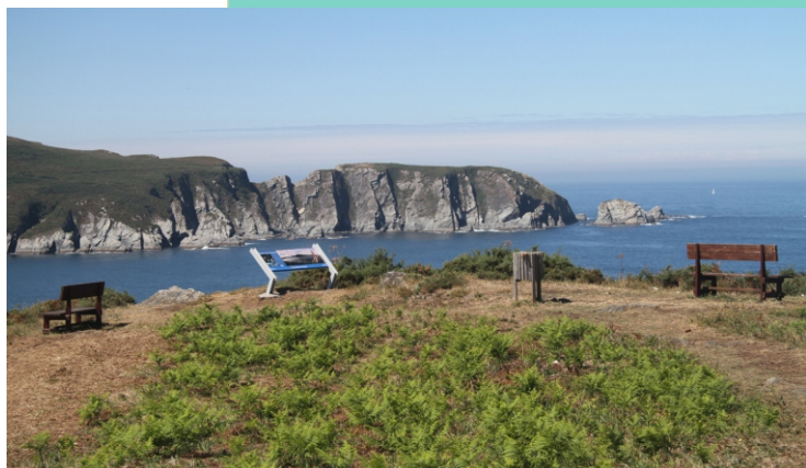
Miradoiro na punta Sarridal