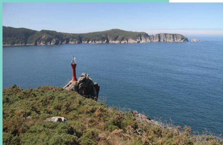
Faro na punta Sarridal