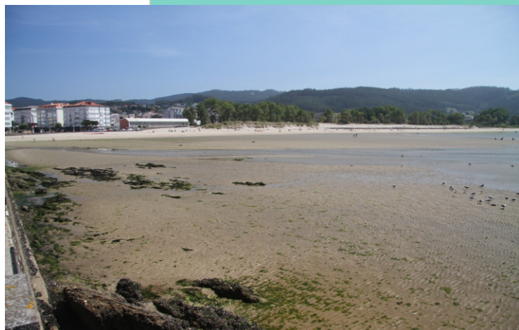
Río Condomiñas e praia da Madalena