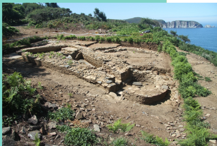
Castro na punta Sarridal. Restos dun balneario castrexo