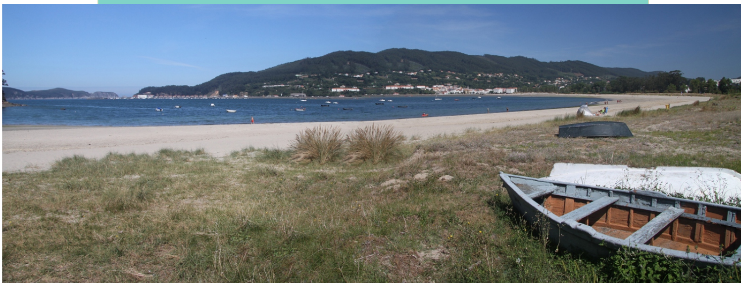
Praias de Santo Isidro e A Madalena, con Cedeira ao fondo