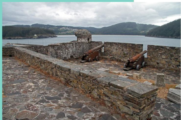
Castelo da Concepción na punta Sarridal