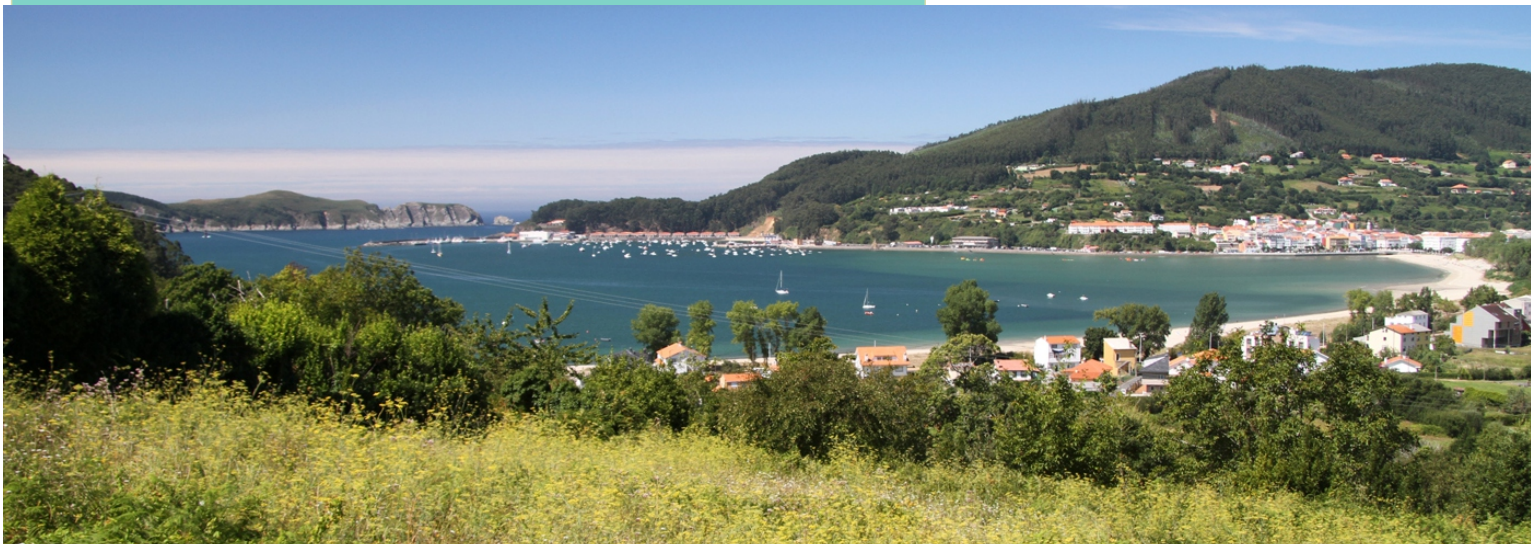
Ría de Cedeira, entre as puntas Chirlateira e Sarridal

O traxecto á punta Robaleira é un camiño polo medio de árbores desde o que se ve pouco pero desde o faro hai unha fermosa vista do conxunto. A praia, unha ou tres separadas por regueiros, conserva parte do sistema dunar coa vexetación propia aínda que bastante estragada polo exceso de presión humana, pódese percorrer a todo o longo pola area ata a desembocadura do río Condomiñas e despois de cruzar a ponte continuamos pola beira da estrada ata o porto pasando ao pé do monumento á muller do pescador, onde a rocha que o soporta mostra uns fermosos pregues, e da praia de Area Longa . Do porto subimos ao castelo da Concepción, que acolle un centro de interpretación, desde alí ao aparcamento e desde el á punta Sarridal . Podemos subir ao castelo da Concepción e achegarnos ao miradoiro da Punta Sarridal e ao castro no que se aprecian os restos dun balneario castrexo.