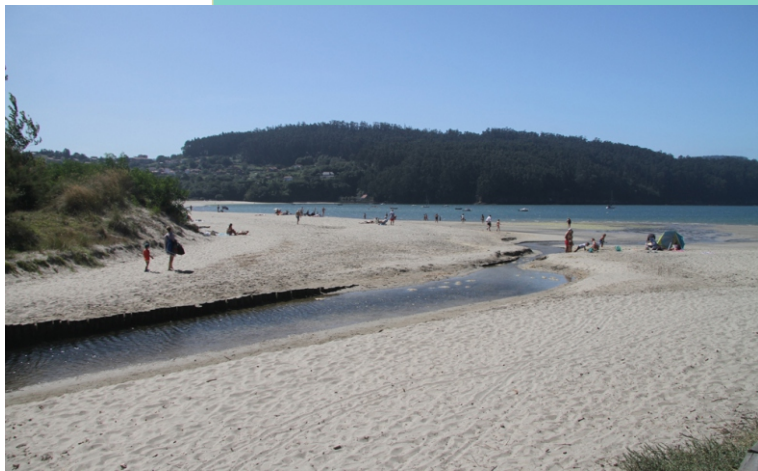
Rego das Veigas entre as praias de Santo Isidro e A Madalena