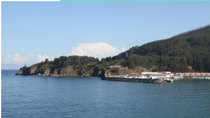
Punta Sarridal e porto de Cedeira