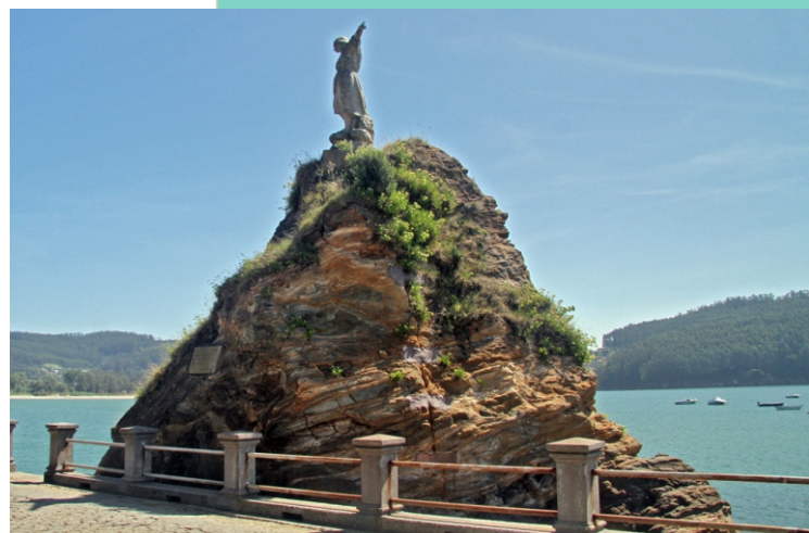
Pregues nas rochas do porto de Cedeira